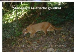
Standaard Aziatische goudkat