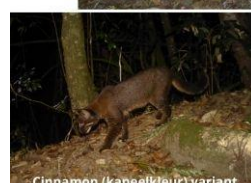
Cinnamon (kaneelkleur) variant