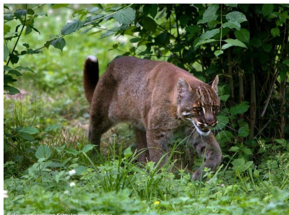
Aziatische goudkat ( Catopuma temminckii )

In Afrika leeft ook een goudkat, de Afrikaanse goudkat. Hij lijkt wel op de Aziatische goudkat, maar ze zijn niet verwant aan elkaar.