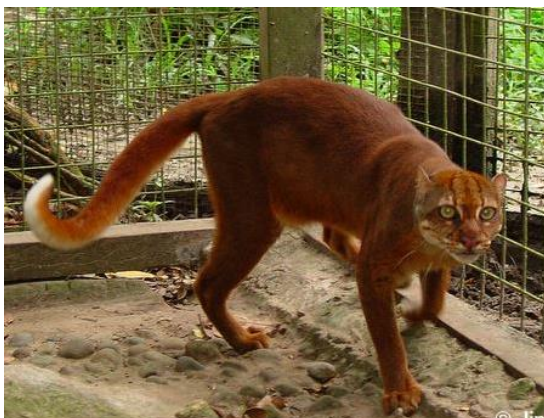
Borneo kat ( Catopuma badia )

De Aziatische goudkat is verwant aan de Borneokat, die ook in Azië leeft. Ze behoren tot hetzelfde geslacht ( Catopuma ).